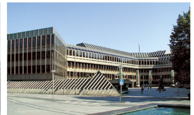
Rathaus | Bielefeld