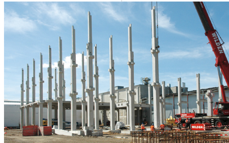
Teekanne | Düsseldorf