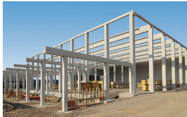
Tiefkühlhaus | Marl