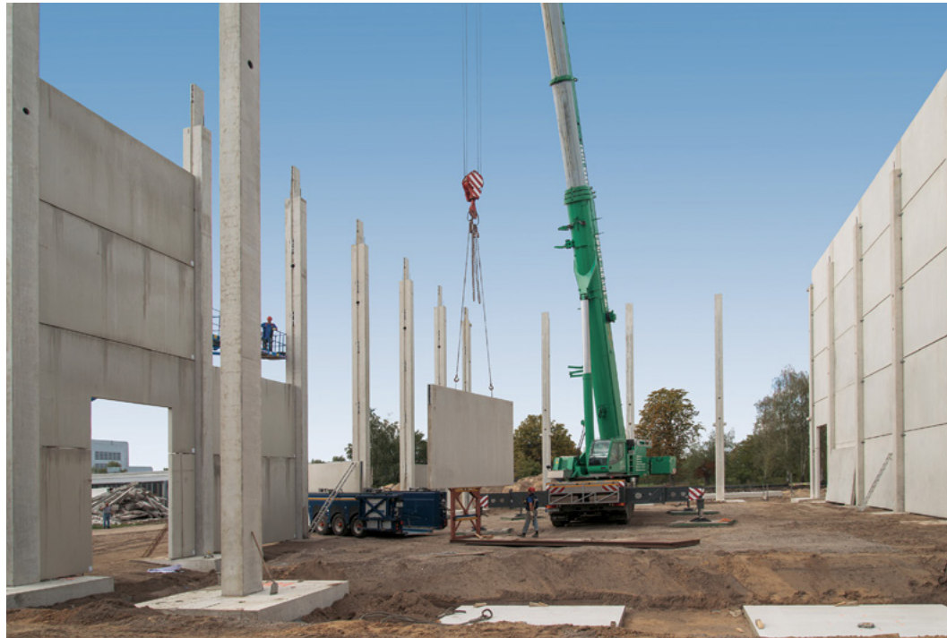
DeWiBack | Berlin