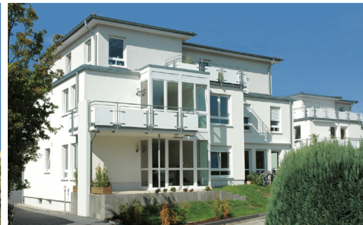
Herrenkamp | Bielefeld