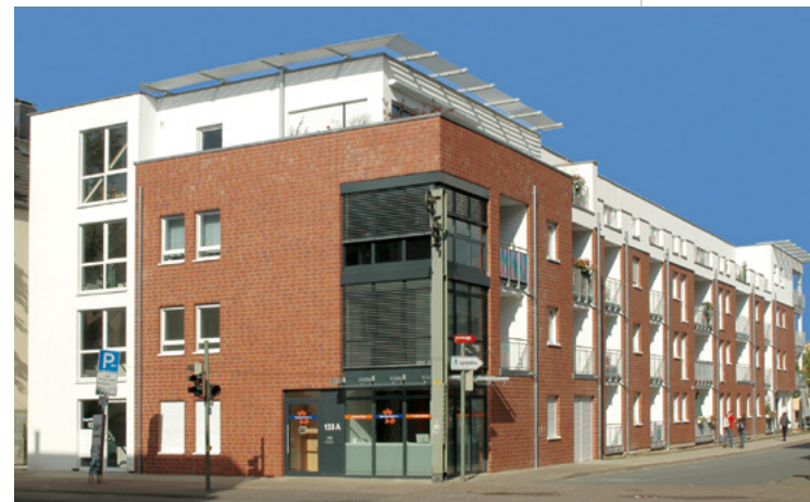
Carl-Schmidt-Straße | Bielefeld