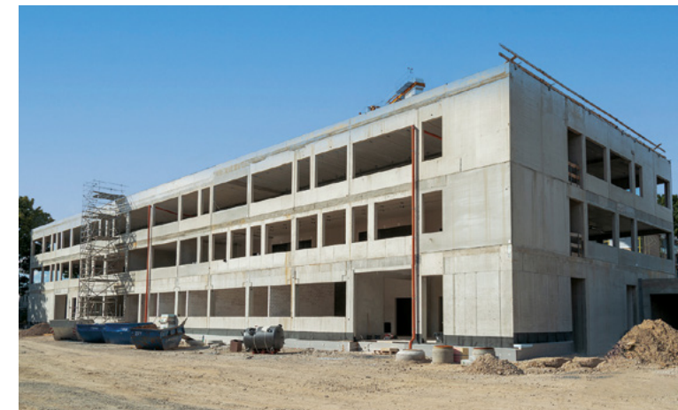
Stadwerke | Detmold