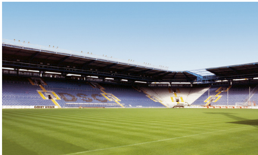
SchücoArena | Bielefeld