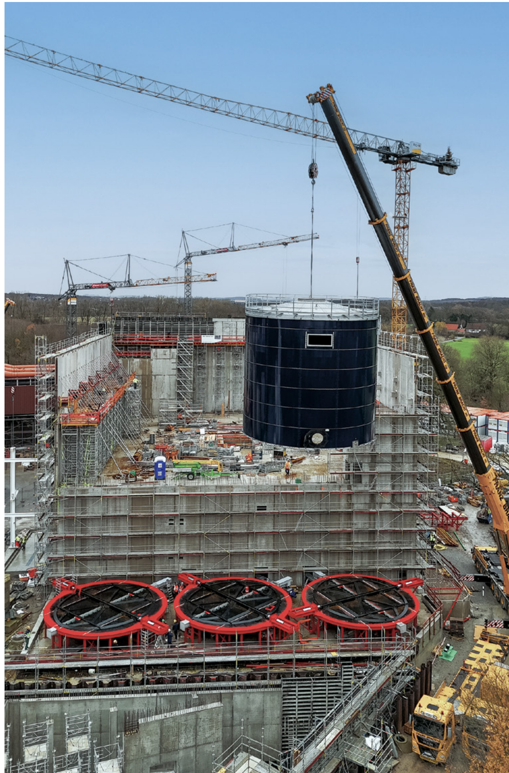
Klärschlamm-Monoverbrennungsanlage | Bielefeld