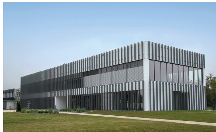
Plasmatreat | Steinhagen