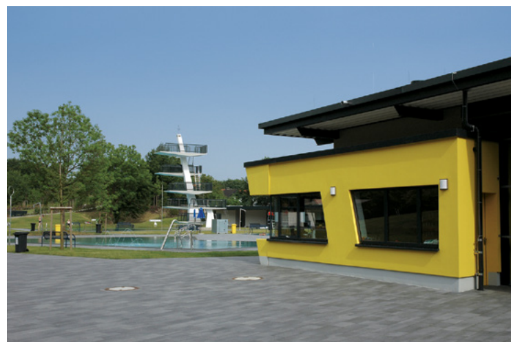
Rolandsbad | Paderborn