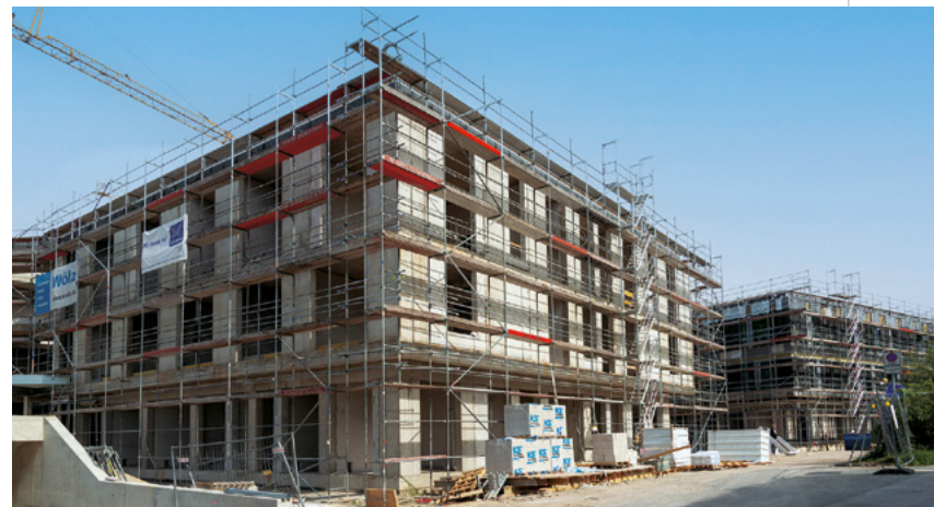
Kinderzentrum Bethel | Bielefeld