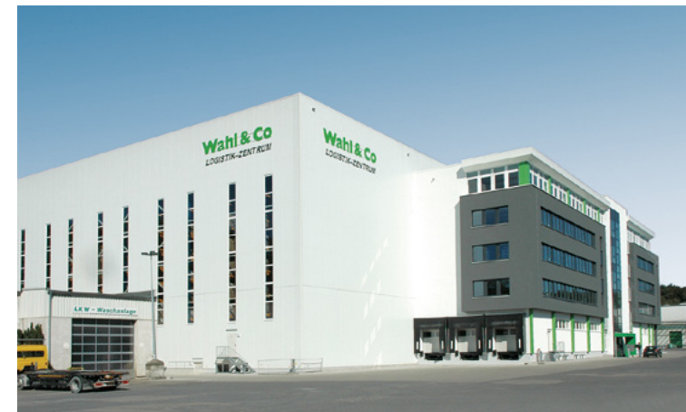
Wahl & Co | Bielefeld