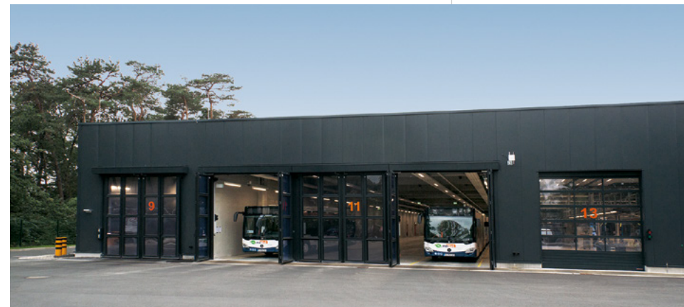
moBiel Busbetriebshof | Bielefeld