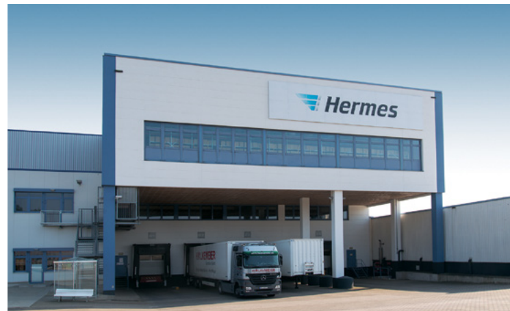
Hermes | Löhne