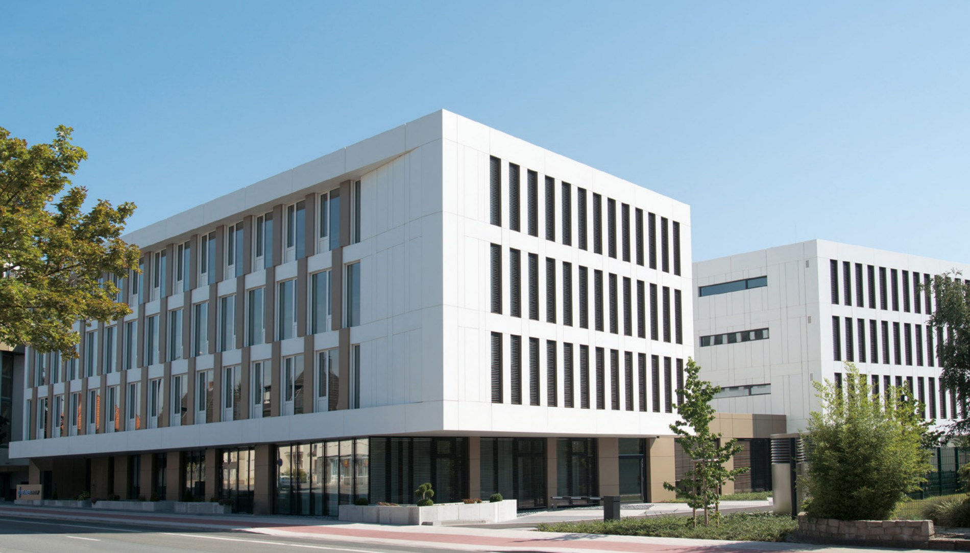
Beumer Group | Beckum