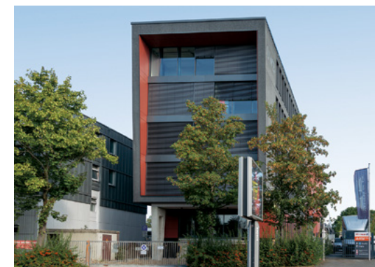
Umweltbetrieb | Bielefeld