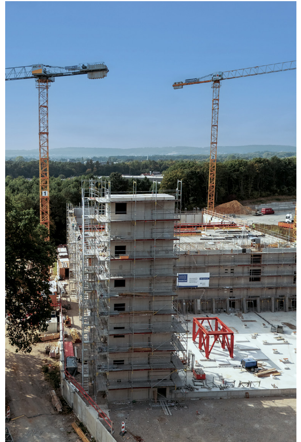
Klärschlamm-Monoverbrennungsanlage | Bielefeld