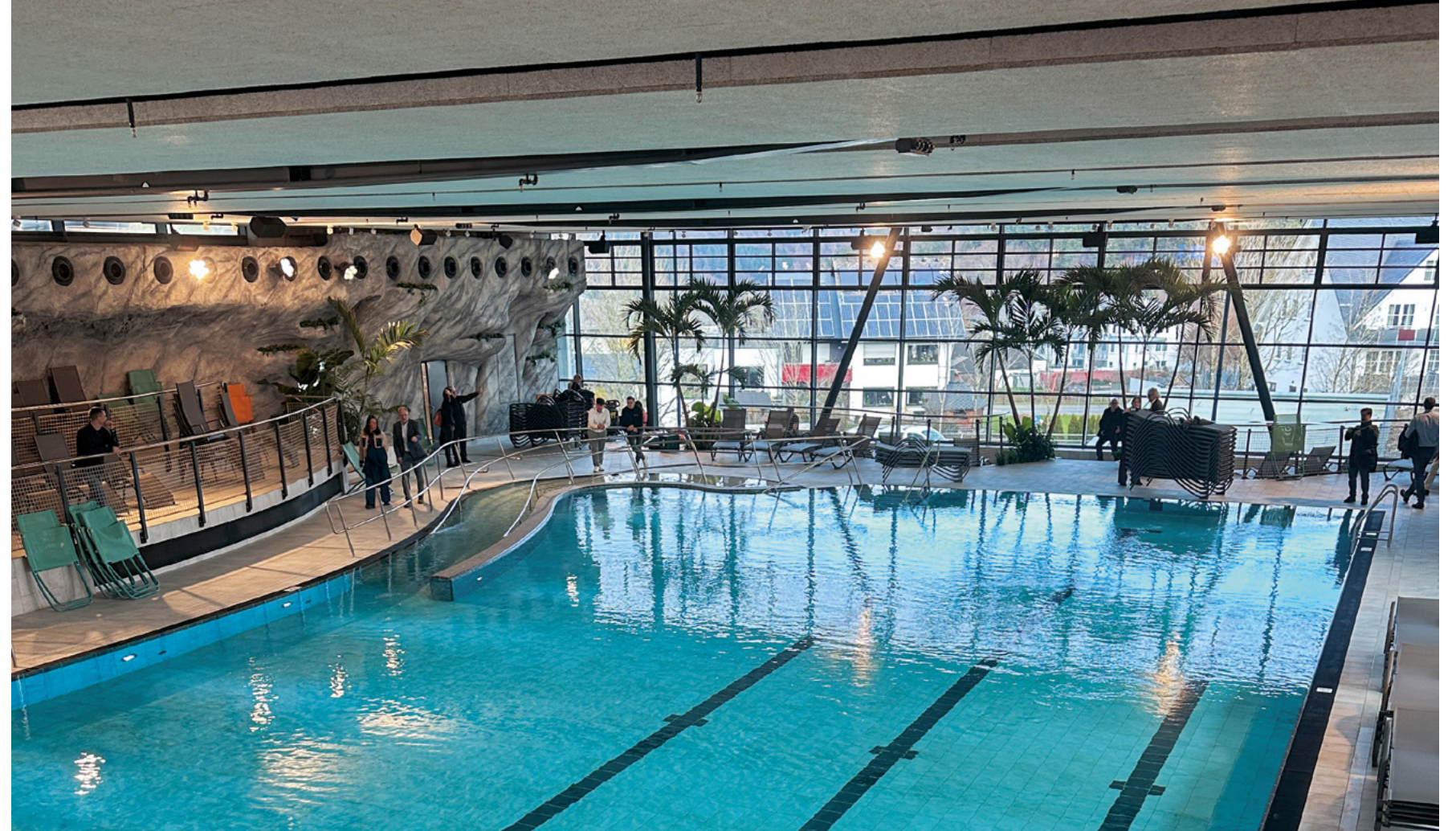
Lagunen-Erlebnisbad | Willingen

Alle Fußballfans kennen sie, die SchücoArena in Bielefeld und viele haben sogar schon einmal bei einem Spiel von Arminia Bielefeld mitgefiebert. Aber wussten Sie auch, dass sich unter ihren Sitzen eine Konstruktion aus Stahlbetonfertigteilen der Baugesellschaft Sudbrack befindet? Wir haben vor fast zwanzig Jahren die Erweiterung des Stadions, die einem Neubau gleich kam, mit den Spezialisten unserer Fertigteileabteilung realisiert. Wenn Sie nicht nur zuschauen, sondern selbst aktiv werden wollen, dann gehen Sie schwimmen. Ob in Bielefeld, Paderborn oder Willingen – Sie haben die Auswahl aus vier modernen Hallenbädern, die von uns realisiert wurden. Überzeugen Sie sich selbst von der erstklassigen Qualität unserer Bauprojekte!