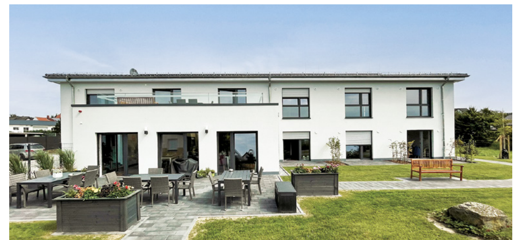
Hausgemeinschaft | Kirchlengern