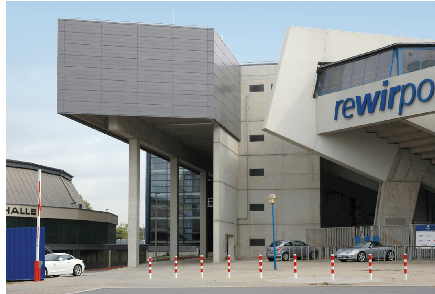
rewirpower-Lounge | rewirpowerstadion | Bochum