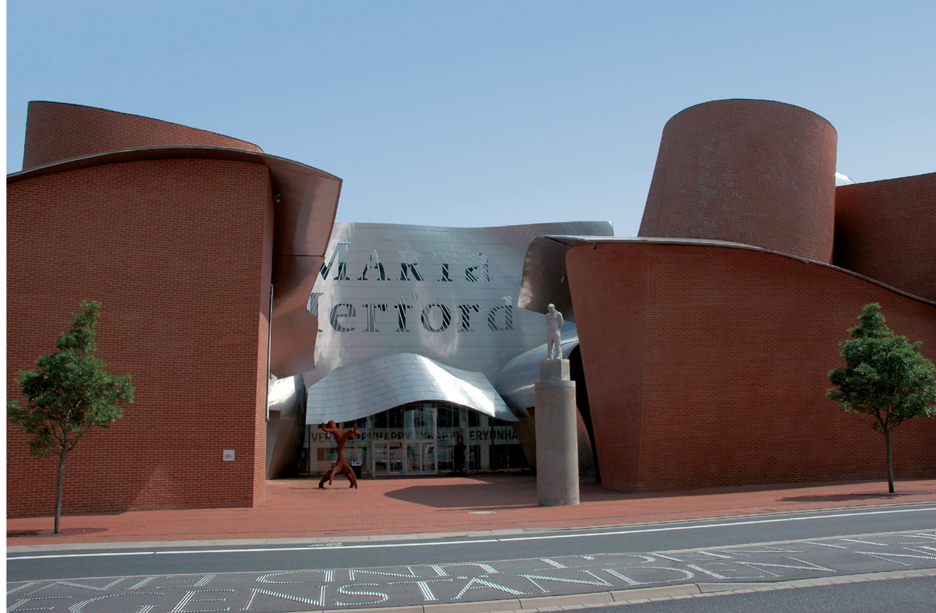
Museum MARTa | Herford