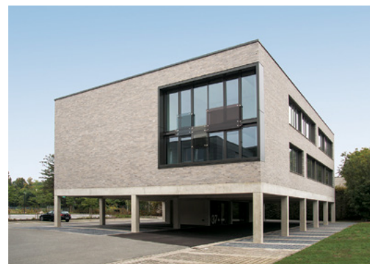
Osthusenrich Stiftung | Halle in Westfalen