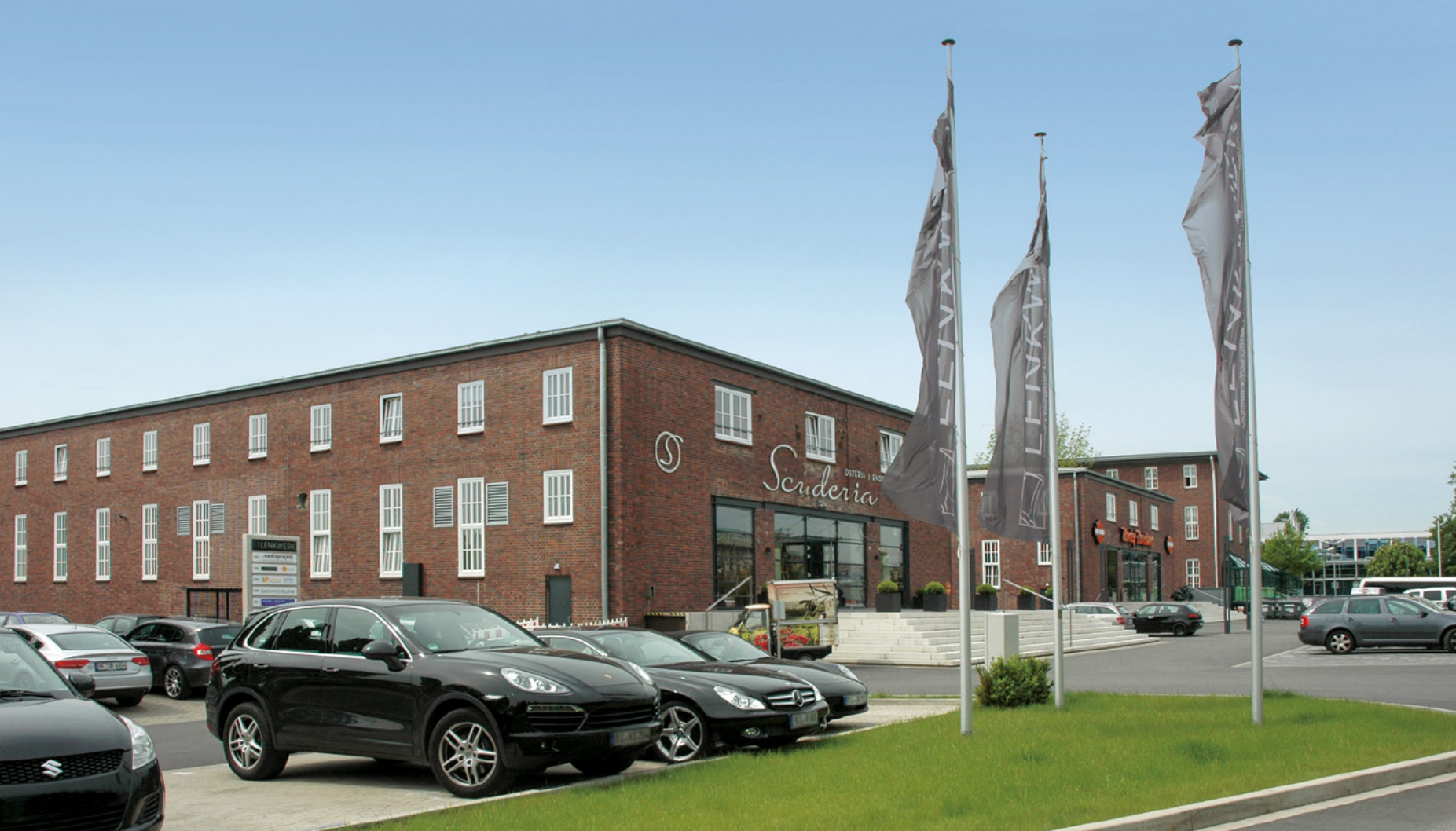
Lenkwerk | Bielefeld