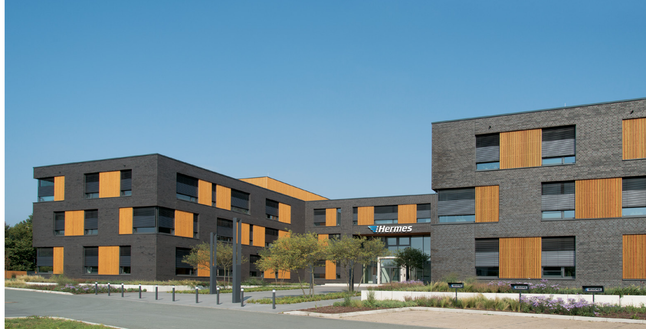
Hermes | Löhne

Das Verwaltungsgebäude und Schulungszentrum für den Hermes Versand wurde nach den Richtlinien der Deutschen Gesellschaft für Nachhaltiges Bauen zertifiziert (DGNB Gold). Das unter ökologischen Aspekten konzipierte Gebäude ist mit einer Geothermie-Anlage zur Beheizung und Kühlung (Betonkernaktivierung) ausgestattet. Die Versorgung der Anlage erfolgt über 75 Erdsonden in je 99 Metern Tiefe. Der anspruchsvolle Bau wurde von der Baugesellschaft Sudbrack schlüsselfertig inklusive Ausführungsplanung errichtet.