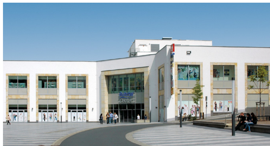
Ruhrtal Center | Wetter