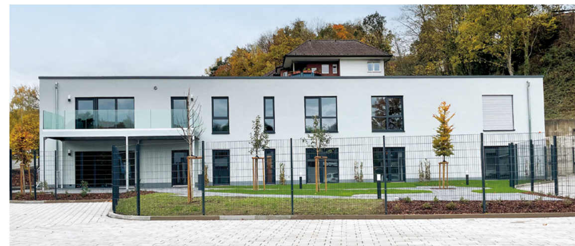
Wohngemeinschaft | Vlotho