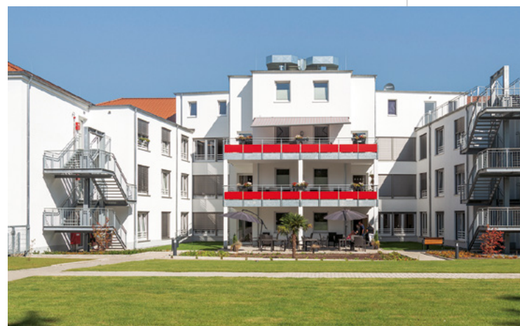
Altenheim Lutherstift | Bielefeld