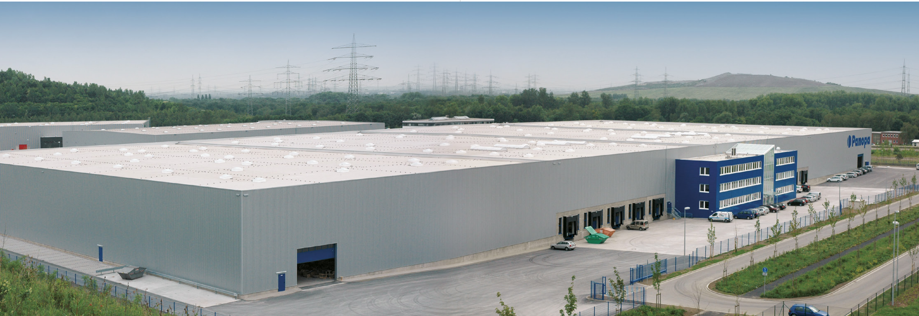
Panopa | Herten