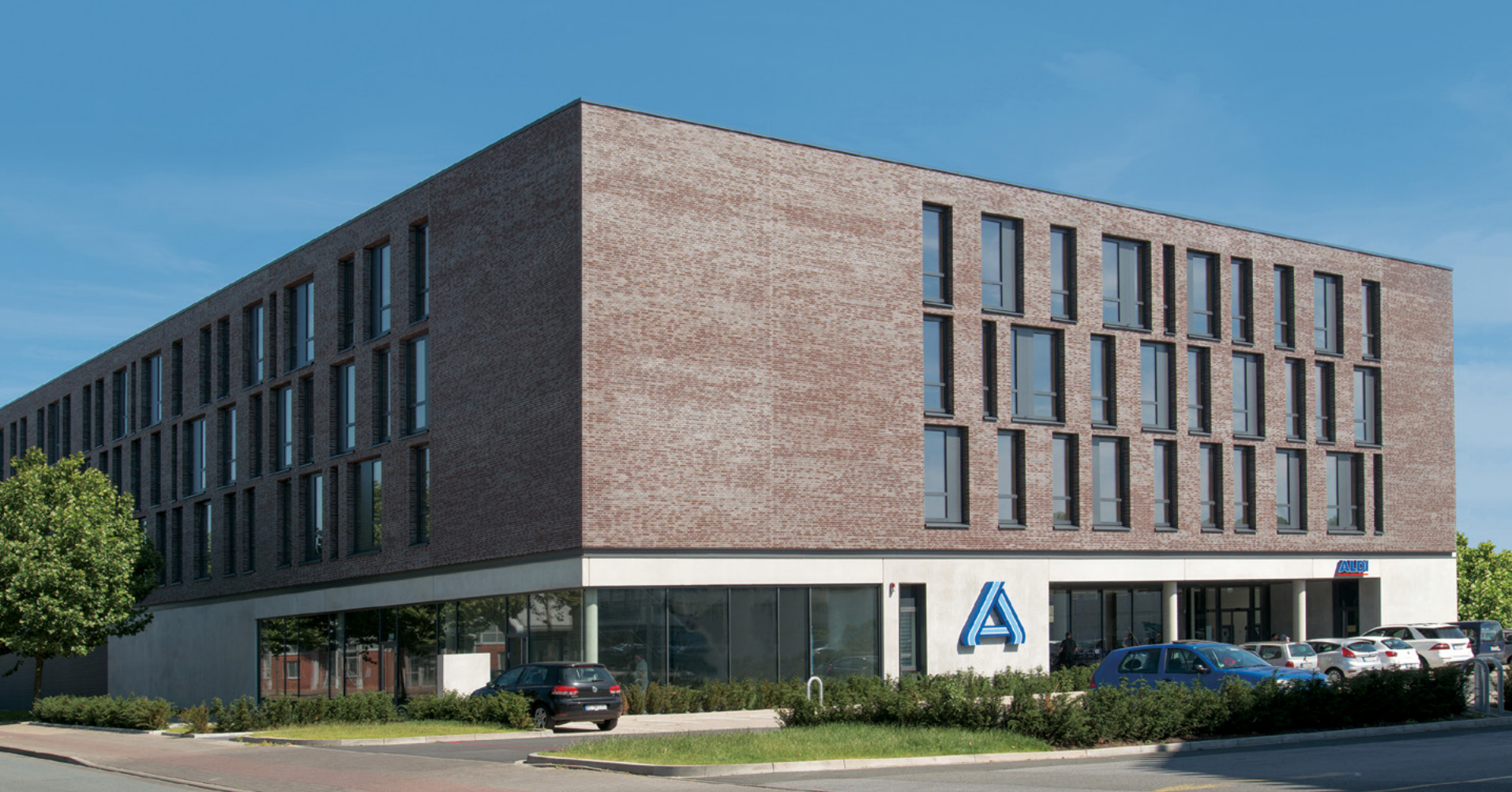
Aldi | Bielefeld