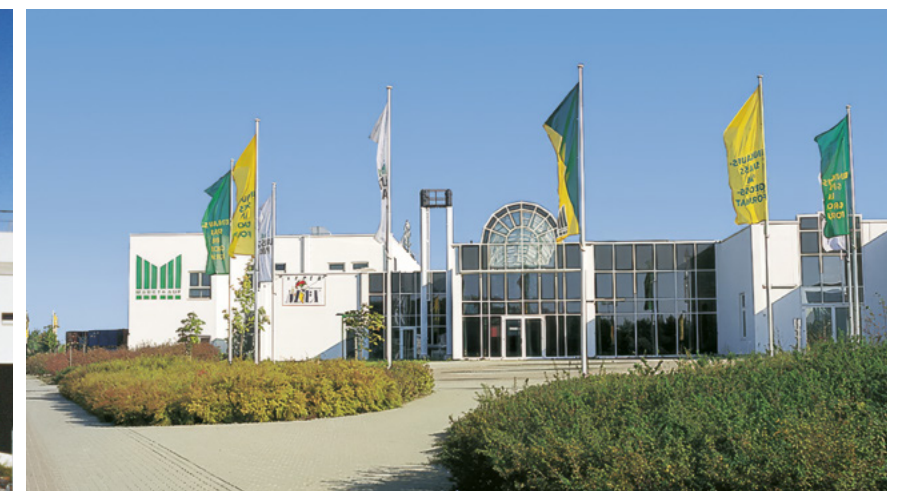
Lausitz Park | Cottbus