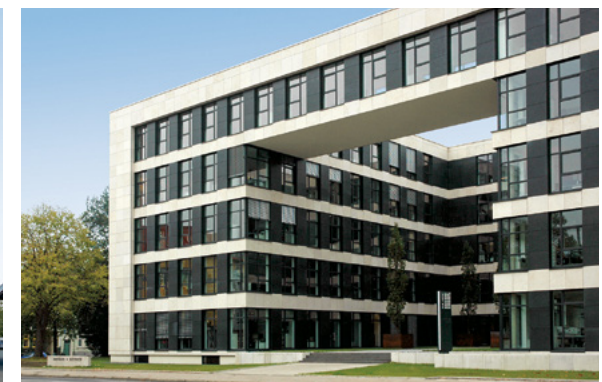
Borchard + Dietrich | Bielefeld