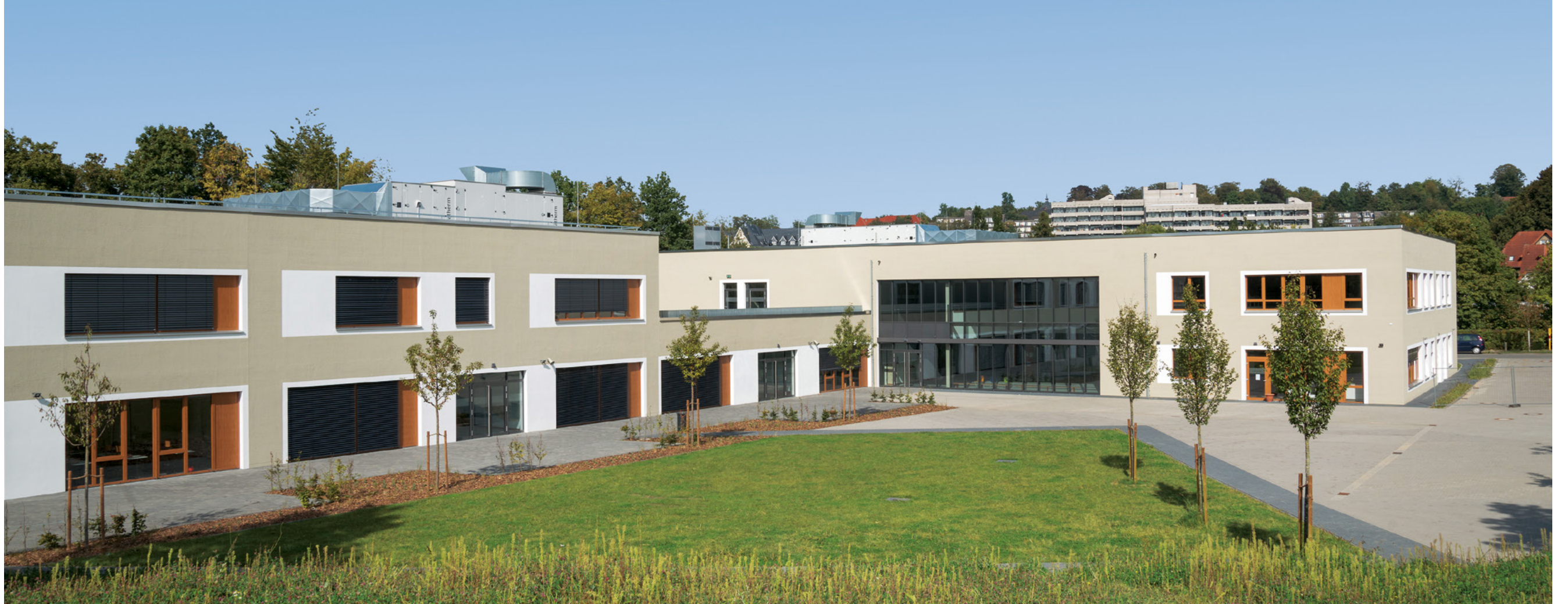
Sekundarschule Bethel | Bielefeld