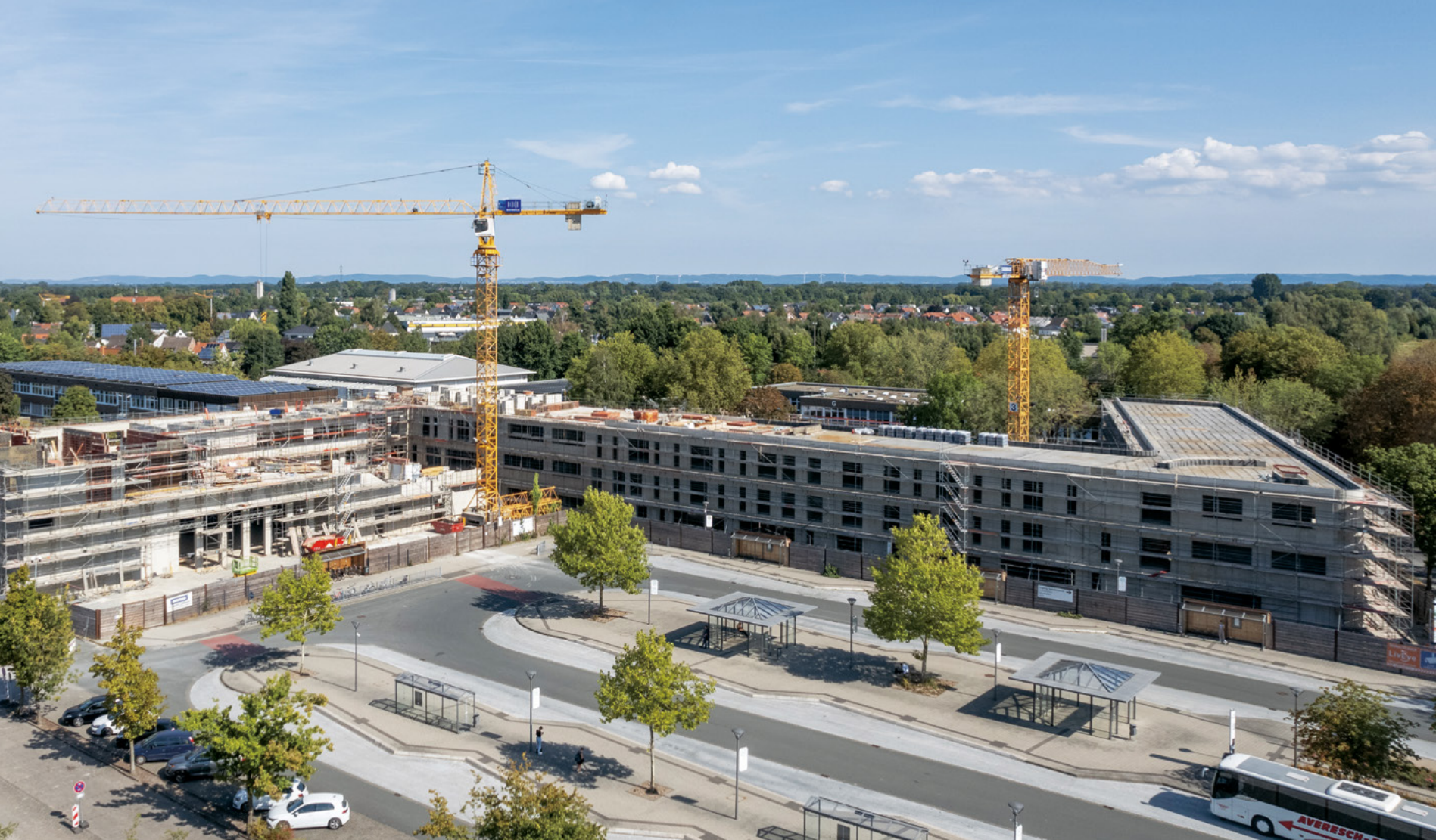
Gymnasium Nepomucenum | Rietberg