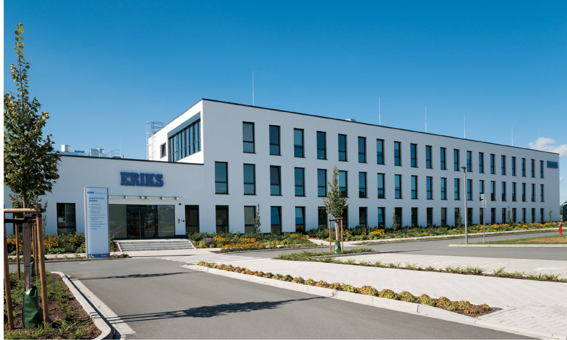
ERIKS | Halle (Westfalen)