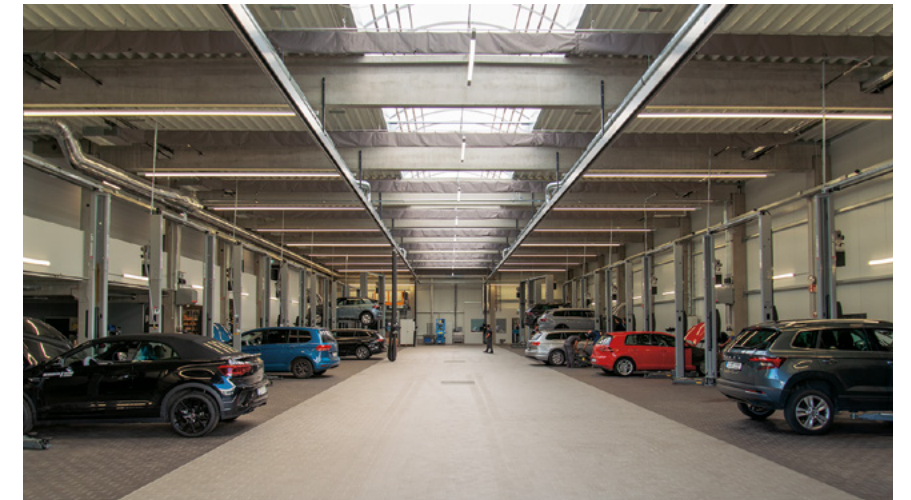
Schröder Team Automobile Servicehalle | Bielefeld