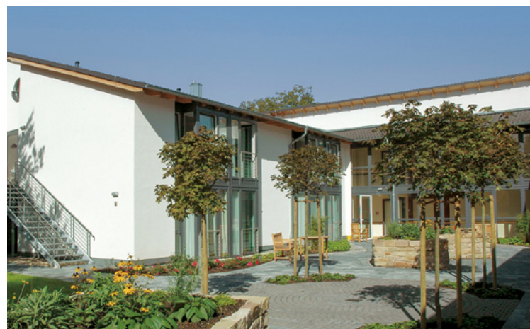
Pflegehaus | Kalletal