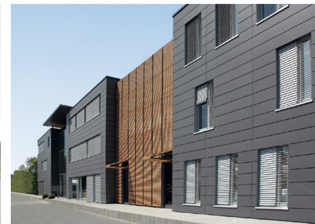
Gehring | Gütersloh