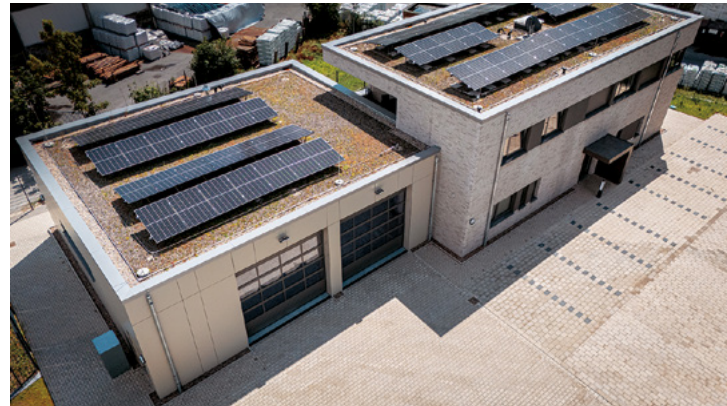
Rettungswache Jöllenbeck in Holzrahmenbauweise | Bielefeld