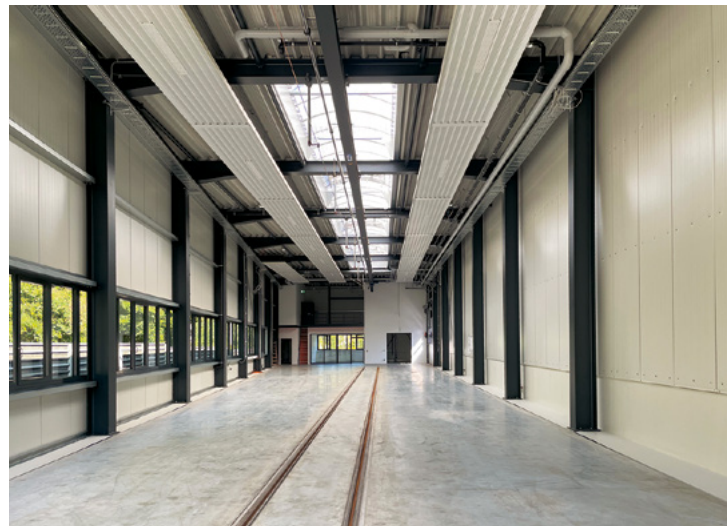
Inbetriebnahmehalle MoBiel | Bielefeld