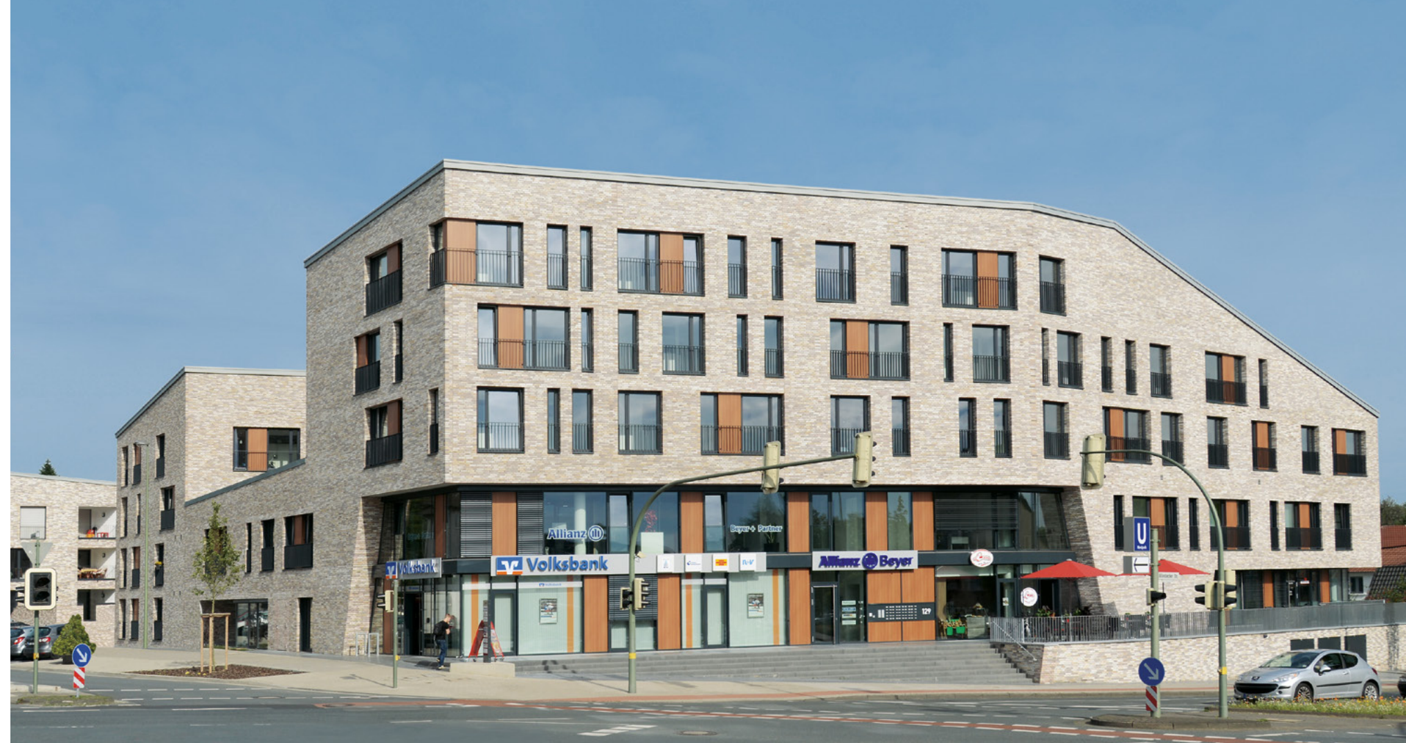
Jöllenbecker Straße | Bielefeld