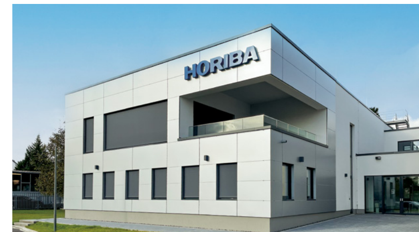
Horiba | Leichlingen