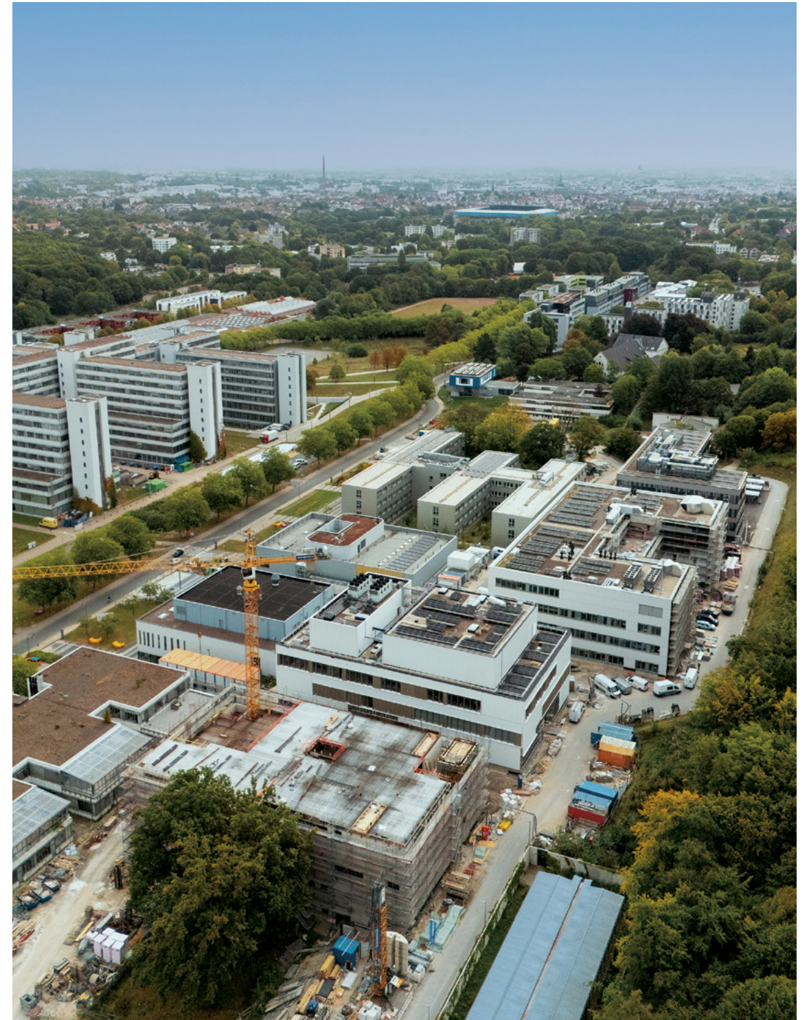
Universität Bielefeld | Erweiterungsbauten R5, R6, R7