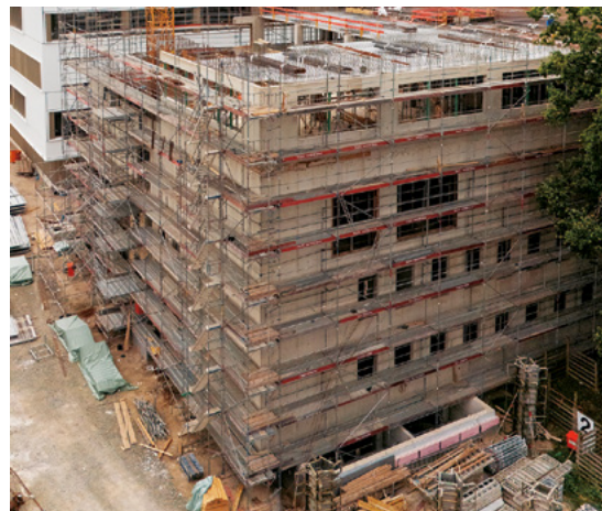
Universität Bielefeld | Erweiterungsbau R7