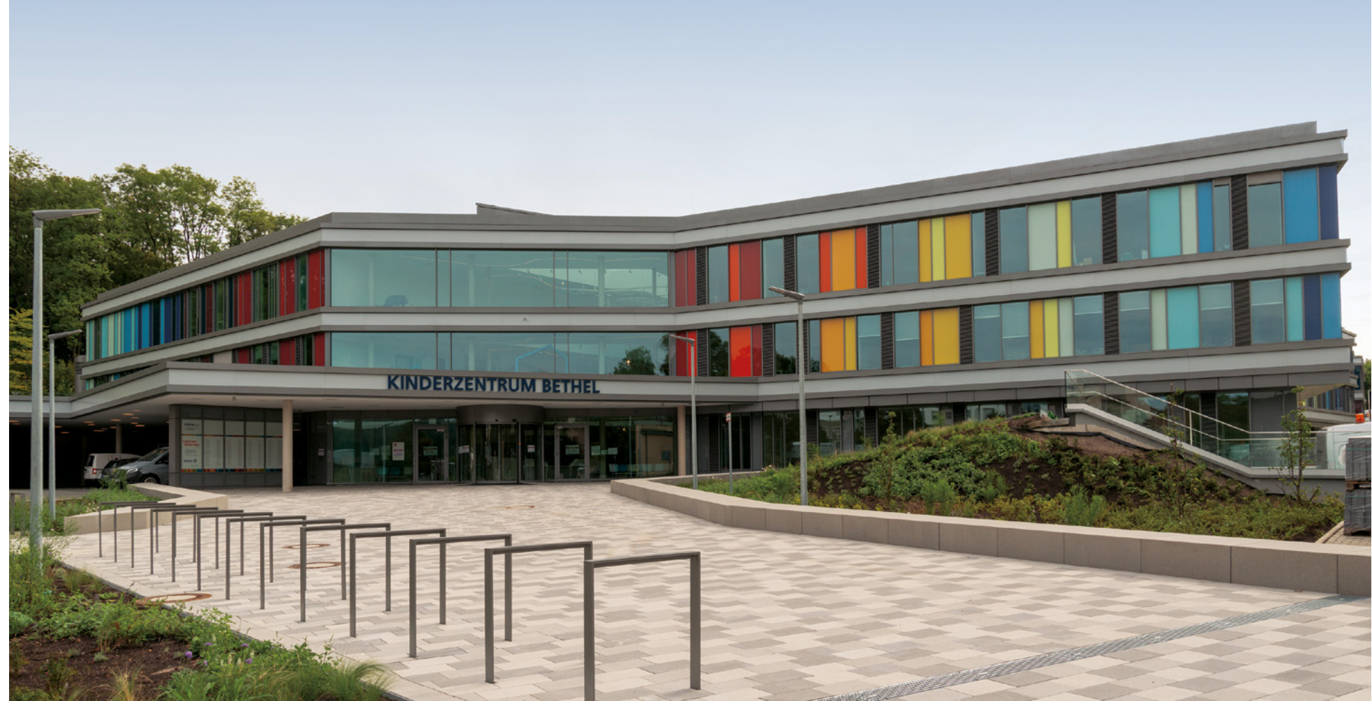
Kinderzentrum Bethel | Bielefeld