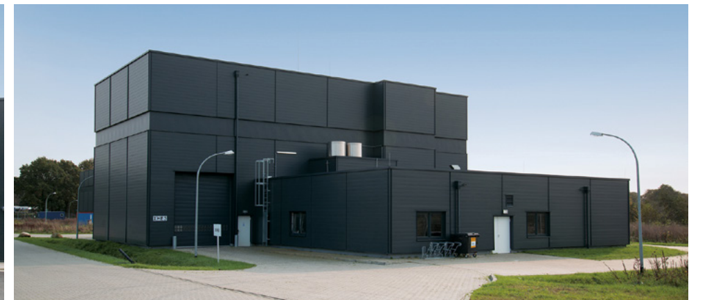
XFEL | Hamburg-Schenefeld