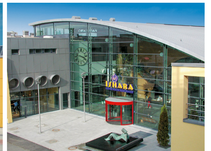
Ishara Bad | Bielefeld