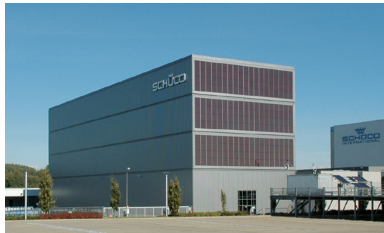
SCHÜCO | Bielefeld