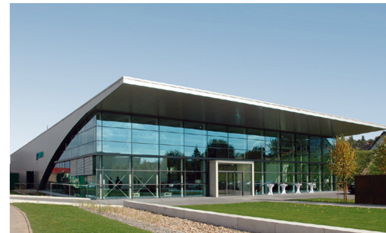
Pronorm | Vlotho