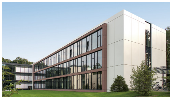
Storck AG | Halle in Westfalen