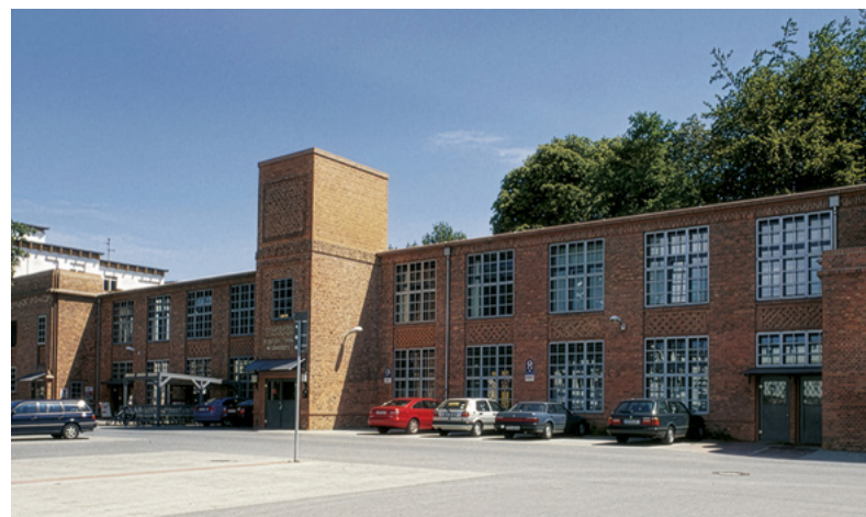
Spinnerei | Cottbus