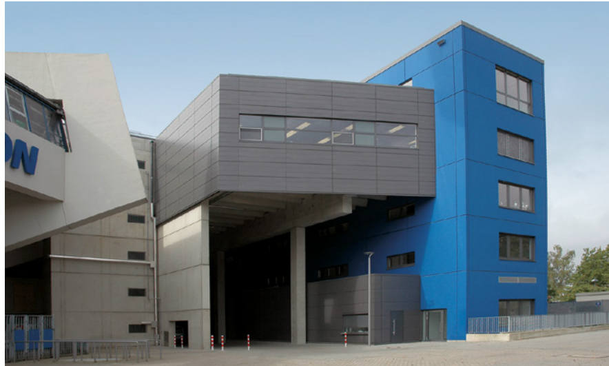
rewirpower-Lounge | rewirpowerstadion | Bochum