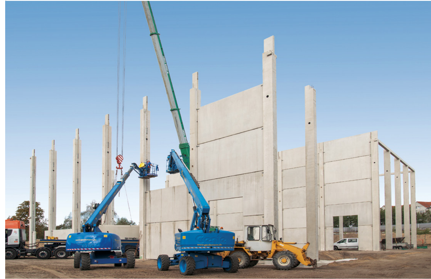
DeWiBack | Berlin