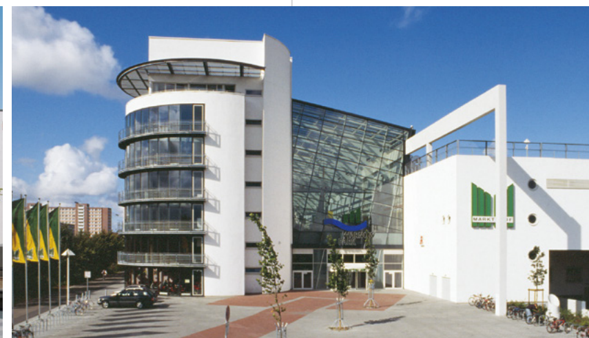
Warnow Park | Rostock