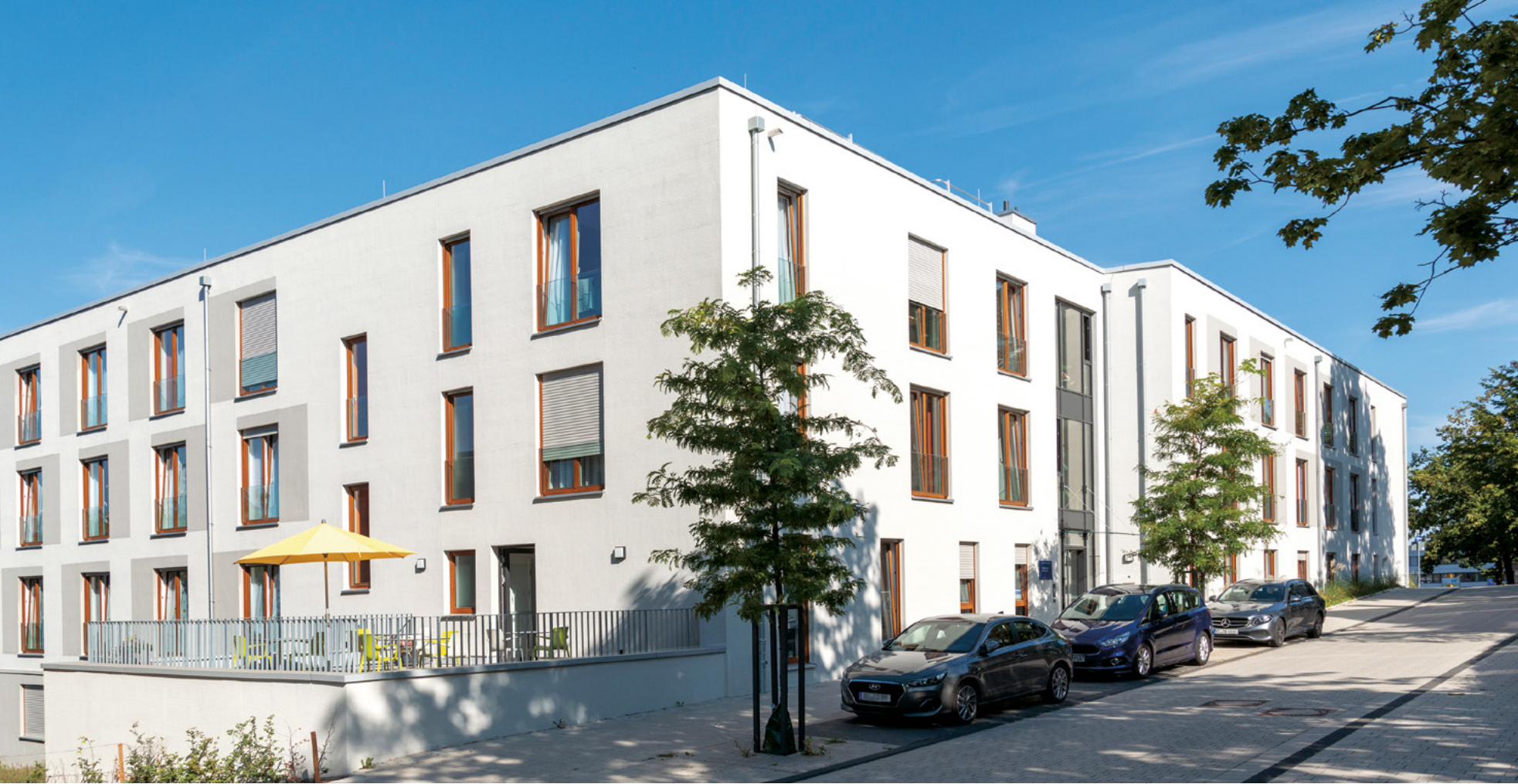
Haus Hannah, Bethel | Bielefeld

Der demografische Wandel zu einer immer älter werdenden Gesellschaft hat zur Folge, dass die Nachfrage nach Pflegeeinrichtungen stetig wächst. So hat auch die Baugesellschaft Sudbrack schon eine Vielzahl von Pflegeheimen mit unterschiedlichsten Gebäudekonzepten errichtet. Häuser mit verschiedenen Wohnbereichen wie Apartments oder Zimmern für alle Pflegestufen sind für uns kein Neuland – wir sind mit den speziellen Anforderungen, die der Bau einer Pflegeeinrichtung erfordert, vertraut.