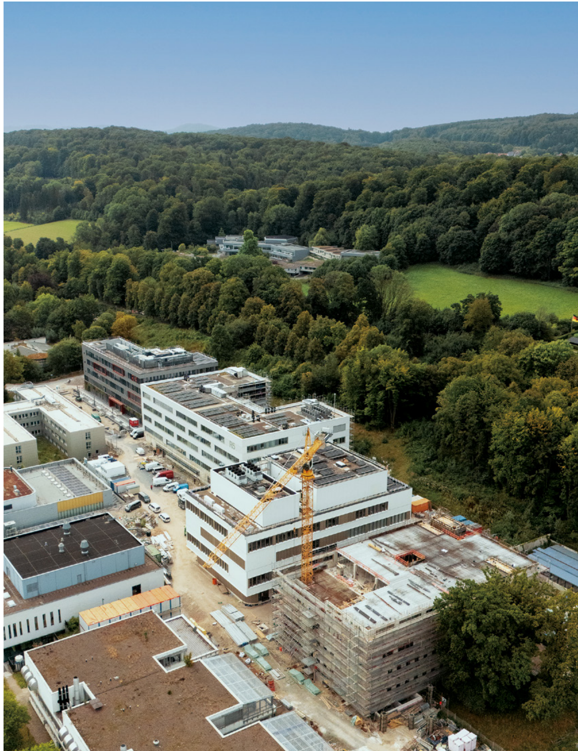
Universität Bielefeld | Erweiterungsbauten R5, R6, R7