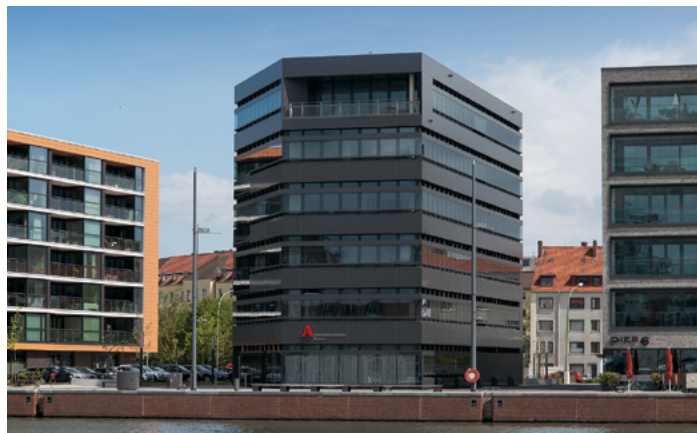
Arbeitnehmerkammer | Bremen