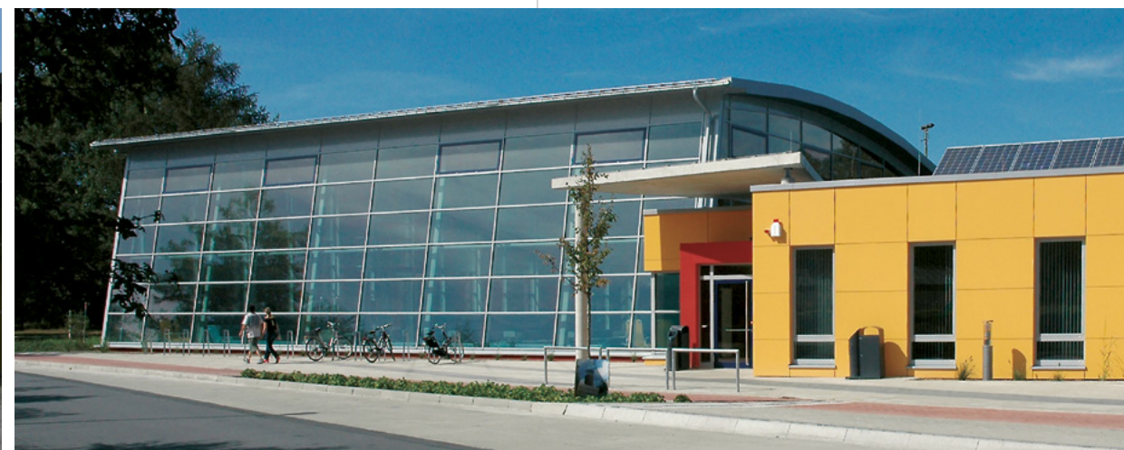
Sportbad | Bielefeld-Sennestadt