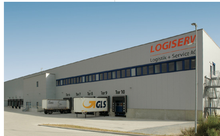
Logiserv | Bönen