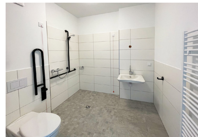
Hausgemeinschaft - Barrierefreies Bad | Kirchlengern