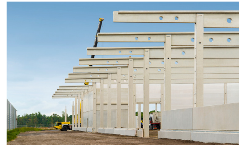
DEG | Dortmund