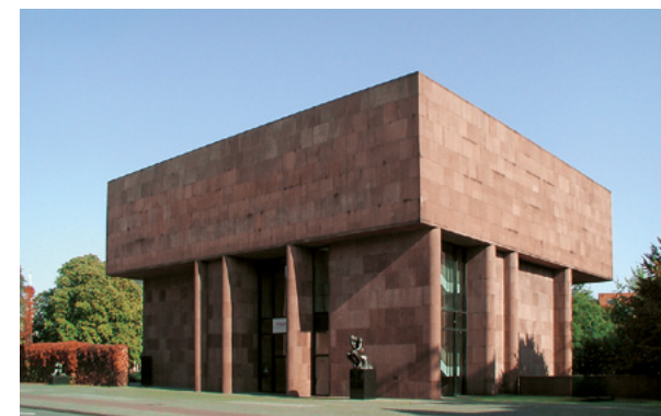
Kunsthalle | Bielefeld