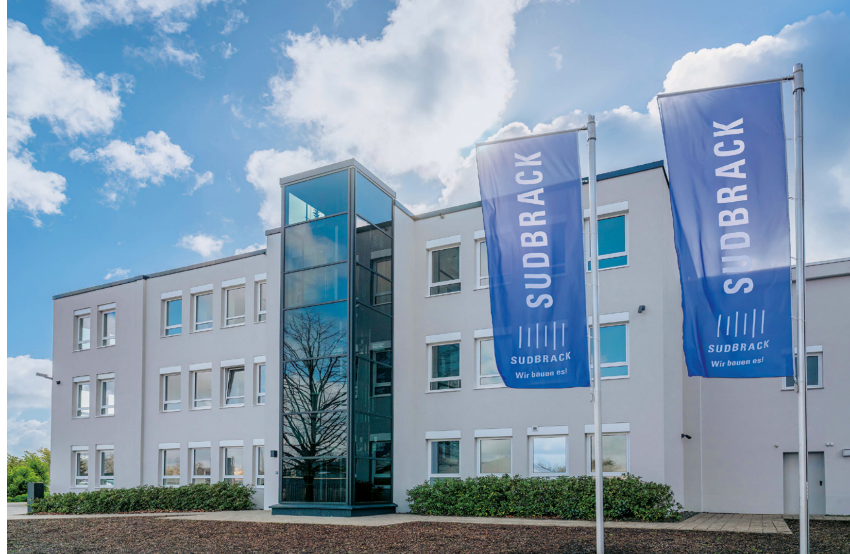
Baugesellschaft Sudbrack | Bielefeld

Neben dem regionalen Schwerpunkt in Ostwestfalen ist das Unternehmen heute bundesweit tätig. Ob Hoch- und Ingenieurbau, Stahlbetonfertigteile oder schlüsselfertiges Bauen – die Baugesellschaft Sudbrack bietet ihren Auftraggebern das komplette Leistungsspektrum aus einer Hand.