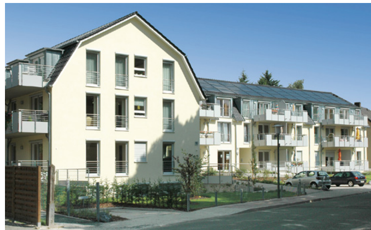
Am Meierteich | Bielefeld