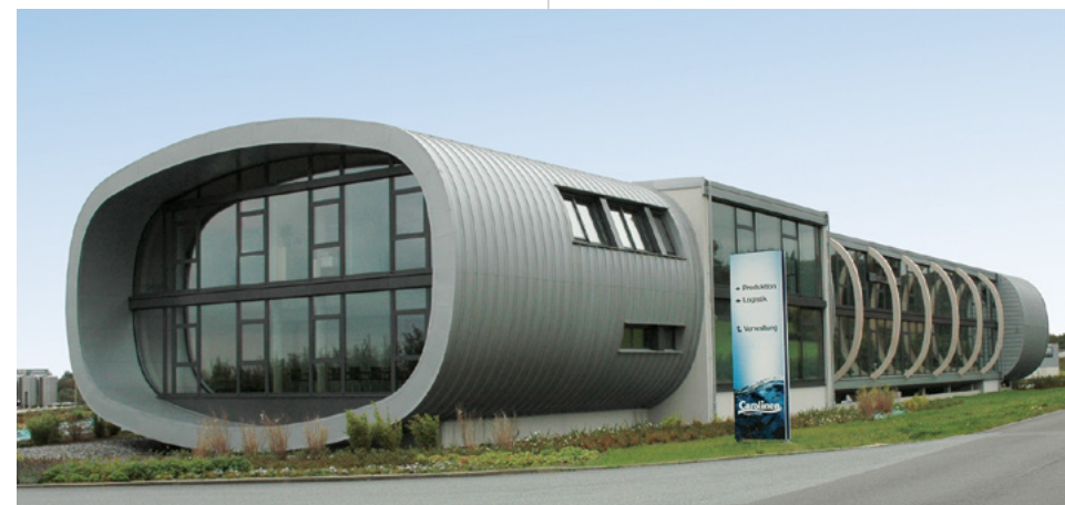
Carolinen Brunnen | Bielefeld